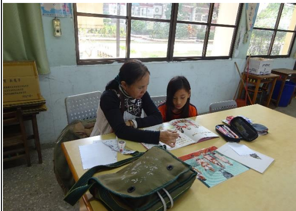
一對一上課，專心學習；看圖識單字。