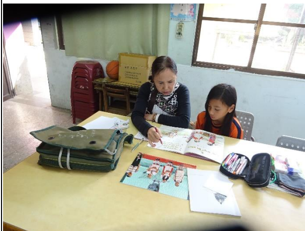
一對一上課，專心學習；看圖說故事。