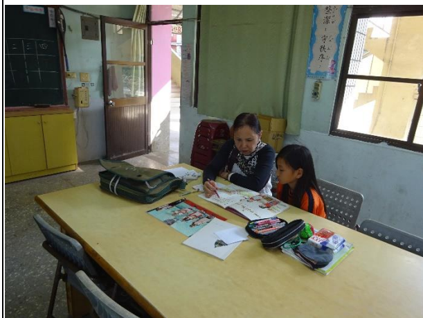
一對一上課，專心學習；看圖學會話。